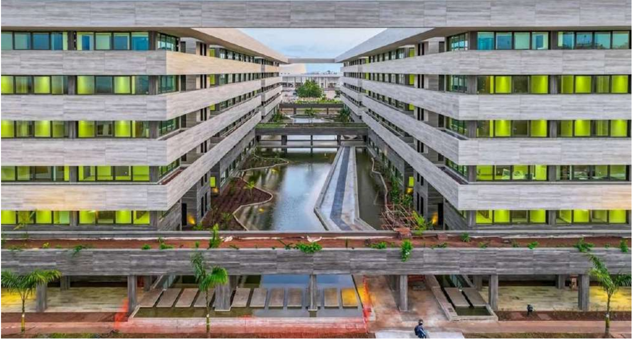
Nouvelle cité ministérielle