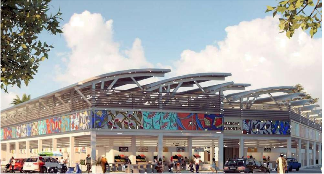
Marchés modernes au Bénin