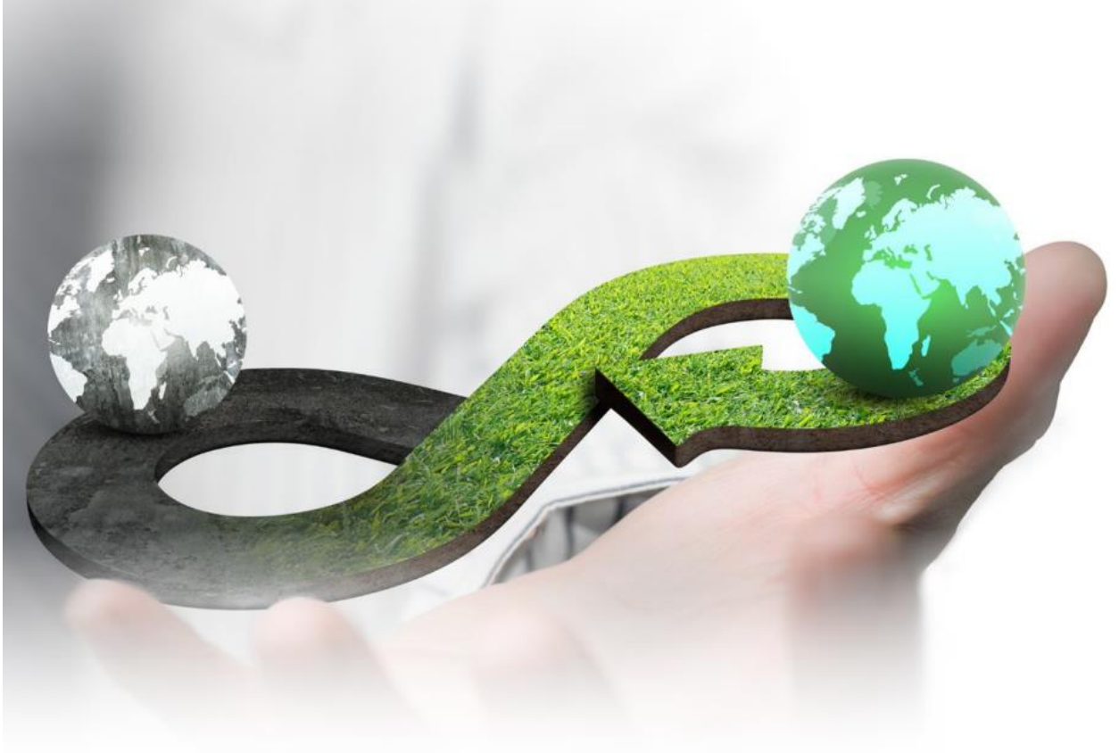
Şekil 8 Yeşil Mutabakatı Eylem Planı “Yeşil ve Döngüsel Bir Ekonomi” (Kaynak: https://ticaret.gov.tr/data/60f1200013b876eb28421b23/MUTABAKAT%20YE%C5%9E%C4%B0L.pdf )

Türkiye, AYM’ye uyum kapsamında 2021 yılında Yeşil Mutabakat Eylem Planı yayımlamıştır. Eylem planında iklim değişikliği ile mücadele, yeşil finansman, AB sınırda karbon düzenlemesi, yeşil ve döngüsel bir ekonomi, temiz, ekonomik ve güvenli enerji arzı, sürdürülebilir tarım, sürdürülebilir akıllı ulaşım ve diplomasi başlıklarında olmak üzere birçok alanda atılacak adımlar yer almaktadır.