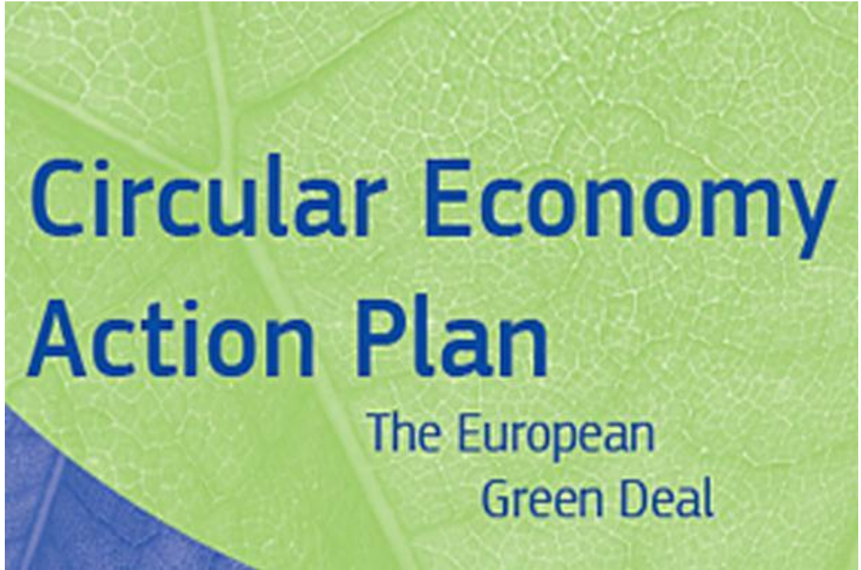
Şekil 5 Avrupa Yeşil Mutabakatı Döngüsel Ekonomi Eylem Planı

kaynakların AB ekonomisinde mümkün olduğunca uzun süre tutulmasını sağlamayı amaçlar. AB düzeyindeki eylemlerin gerçek katma değer sağladığı alanları hedefleyen yasal ve yasama dışı önlemleri sunar.