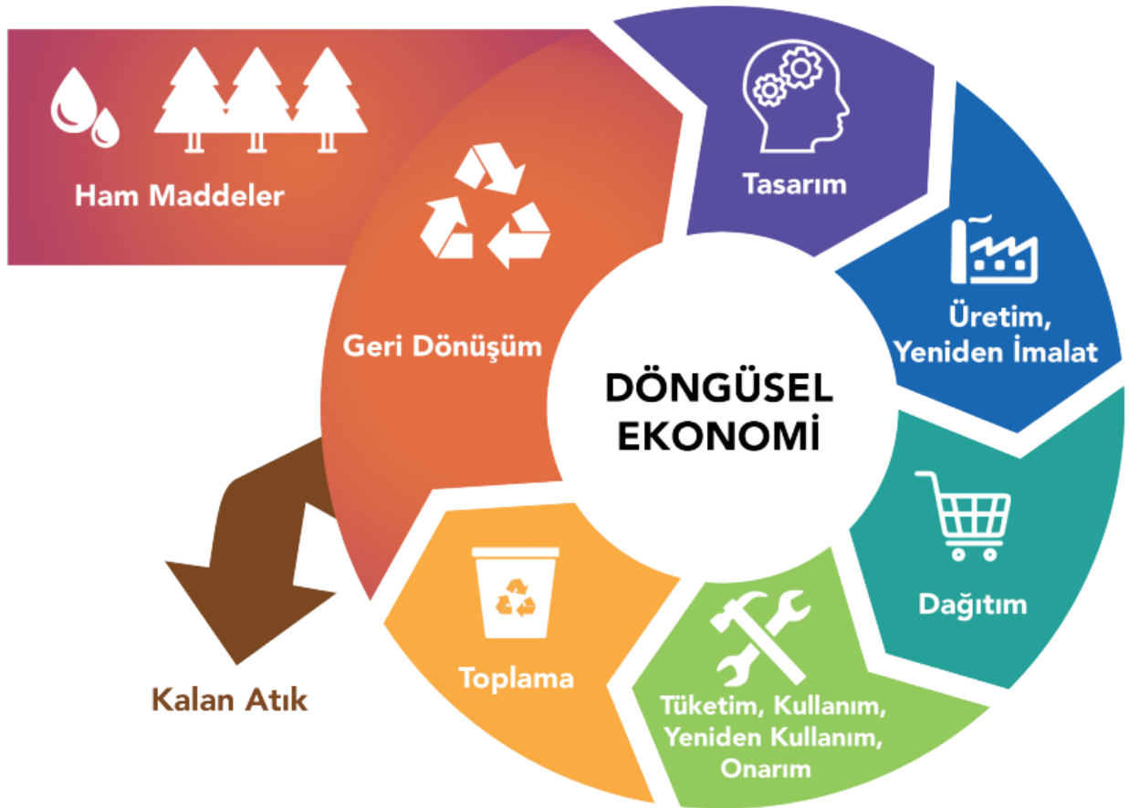
Şekil 4 Döngüsel Ekonomi

Döngüsel bir ekonomide ürünlerin ve malzemelerin değeri mümkün olduğu kadar uzun süre korunur; atık ve kaynak kullanımı en aza indirilir, bir ürün ömrünün sonuna ulaştığında kaynaklar ekonomi içinde tutulur ve daha fazla değer yaratmak için tekrar tekrar kullanılır. Bu model, Avrupa'da güvenli iş olanakları doğurabilir, rekabet avantajı sağlayan yenilikleri teşvik edebilir ve Avrupa'nın gurur duyduğu insanlar ve çevre için bir koruma düzeyi sağlayabilir. Ayrıca tüketicilere parasal tasarruf sağlayan ve yaşam kalitesini artıran daha dayanıklı ve yenilikçi ürünler sunabilmektedir.