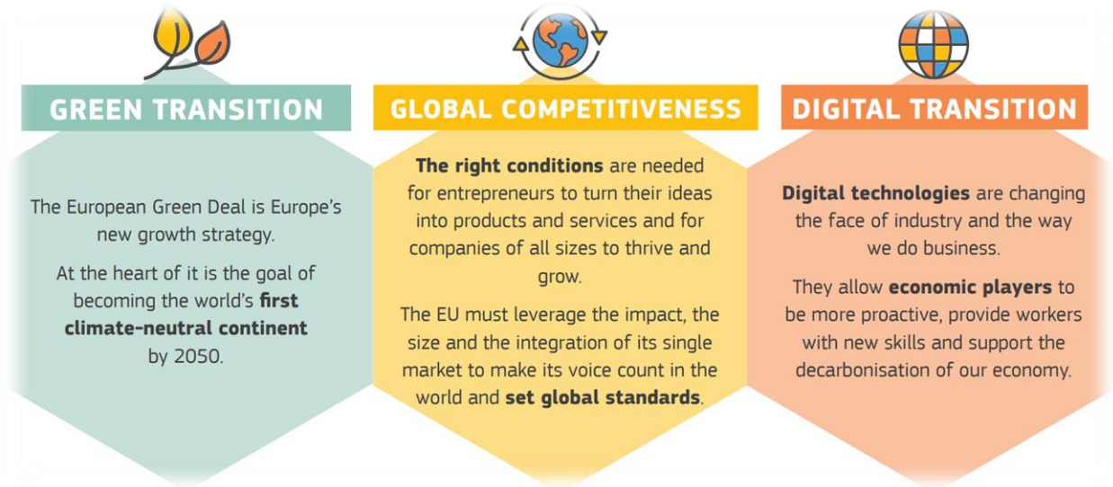
Şekil 2 Avrupa Sanayi Stratejisi: Yeşil geçiş, Küresel rekabet ve Dijital geçiş

Avrupa endüstrisinin küresel sahnede rekabetçi hale gelebilmesi için daha yeşil, daha döngüsel ve daha dijital hale gelmesine ihtiyacı vardır. Bu üç etken endüstriyi dönüştürecek, KOBİ'leri destekleyecek ve Avrupa'yı sürdürülebilir ve rekabetçi tutacaktır. Tek pazarı 2 koruma, rekabet edilebilirliği ve üretkenliği teşvik etme ve de Avrupa endüstrisinin dayanıklılığını artırma amaçları ile Komisyon, 10 Mart 2020'de Yeni Sanayi Stratejisi'ni açıklamıştır. Sanayi Stratejisi ile Komisyon yeşil ve dijital ekonomiye ikili geçişi destekleyecek, AB endüstrisini küresel olarak daha rekabetçi hale getirecek ve Avrupa'nın açık stratejik özerkliğini artıracak bir endüstriyel stratejinin temellerini atmıştır.